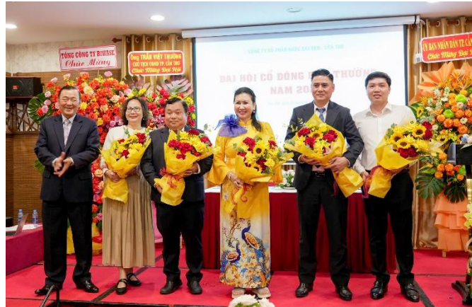
Sau M&A Công ty CP Nước Sài Gòn – Cần Thơ đổi tên thành Công ty CP BIWASE Cần Thơ và tăng 100% công suất.

• Diễn đàn M&A Việt Nam lần thứ 16 năm 2024 diễn ra vào chiều 27/11/2024 do Báo Đầu tư tổ chức dưới sự chỉ đạo và bảo trợ của Bộ Kế hoạch và Đầu tư, Công ty CP - Tổng Công ty Nước - Môi trường Bình Dương (BIWASE) vinh dự được nhận giải thưởng “Doanh nghiệp có thương vụ M&A tiêu biểu năm 2023 - 2024”. BIWASE đã làm tốt nhiệm vụ cung cấp nước sạch cho dân cư đô thị, vùng sâu vùng xa và nước sạch cho sản xuất công nghiệp với trên 99% hộ gia đình trong tỉnh Bình Dương được sử dụng nước sạch. Từ đó, BIWASE vươn mình thực hiện chiến lược mở rộng hoạt động, hỗ trợ ngành cấp nước các tỉnh thành trên cả nước; giúp các địa phương triển khai có hiệu quả chiến lược phát triển đô thị, thu hút đầu tư tại các tỉnh Bình Phước, Long An, Cần Thơ, Đồng Nai, Quảng Bình, Vĩnh Long và một số tỉnh thành khác. Chỉ riêng trong năm 2024, sau khi M&A thành công Công ty Cổ phần Nước Sài Gòn - Cần Thơ, BIWASE đã tiếp quản vai trò quản lý điều hành, đổi tên công ty thành Công ty Cổ phần Nước BIWASE Cần Thơ và tiếp tục tăng vốn để nâng công suất toàn bộ dự án lên 50.000 m 3 /ngày đêm; góp vốn tại Công ty Cổ phần Đầu tư nước Tân Hiệp 2 (804,9 tỷ đồng chiếm 43%) và trở thành cổ đông lớn nhất tại đơn vị này.