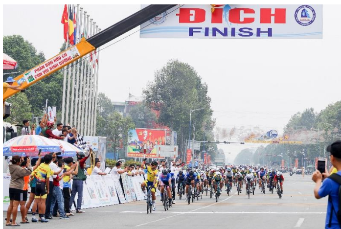
Từ năm 2025, Giải Xe đạp nữ Quốc tế Bình Dương chính thức gia nhập hệ thống thi đấu tính điểm UCI của Liên đoàn Xe đạp Thế giới với tên gọi mới: " BIWASE Tour of Vietnam ".

tác triển khai tổ chức giải hàng năm và sự đồng hành đầy trách nhiệm của các Câu lạc bộ, vận động viên Xe đạp Việt Nam trong việc duy trì, phát triển bộ môn Xe đạp nữ thời gian qua. Điều này góp phần nâng cao vị thế của Xe đạp nữ Bình Dương, cũng như phong trào Xe đạp nữ Việt Nam trên bản đồ thể thao quốc tế. Đồng thời, đây cũng là cơ hội quan trọng để các vận động viên Việt Nam có thể tham gia các giải thi đấu tầm cỡ thế giới trong tương lai.