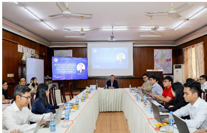
Đại diện các tổ chức tín dụng, quỹ đầu tư tìm kiếm cơ hội đầu tư lâu dài tại BIWASE

là hiệu quả quản trị. Hiện có rất nhiều tổ chức tín dụng quốc tế mong muốn được tài trợ các dự án mà BIWASE đang triển khai. Nhưng với đặc thù của ngành cấp thoát nước – môi trường là nguồn vốn lớn, thời gian khấu hao chậm. Để bảo đảm hiệu quả, BIWASE đang tìm kiếm các nhà đầu tư cùng đồng hành theo phương thức “Có trước có sau – Các bên đều có lợi”. Qua buổi tiếp xúc đại diện các quỹ đầu tư tỏ ra phấn khởi và mong muốn được đồng hành cùng BIWASE vì tin tưởng vào sự ổn định và giá trị cổ phiếu trên thị trường.