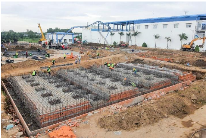
Công ty CP BIWASE Long An triển khai công trình hạ tầng cấp nước từ nguồn vốn trái phiếu

• BIWASE Long An phát hành thành công 700 tỷ đồng trái phiếu. Công ty Cổ phần Nước BIWASE Long An đã phát hành thành công lô trái phiếu 700 tỷ đồng. Mệnh giá 100 triệu đồng/trái phiếu (mã trái phiếu BWLCH2434001), kỳ hạn 10 năm kể từ ngày 27/11/2024 đến ngày 27/11/2034, lãi suất cố định: 5,5%/năm, mức lãi suất tốt nhất trên thị trường huy động nguồn vốn trái phiếu hiện nay. FiiRatings đã xếp hạng tín dụng của trái phiếu BWLCH2434001 hạng AAA. Mục đích phát hành trái phiếu: Đầu tư vào giai đoạn 3 của dự án Nhà máy nước Nhị Thành, nhằm tăng công suất từ 60.000 m 3 /ngày đêm lên 120.000 m 3 /ngày đêm. Lô trái phiếu này được bảo lãnh thanh toán bởi